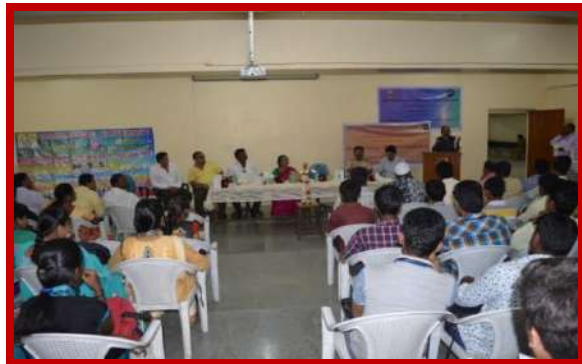
Legal awareness program on 25 th Jan 2016