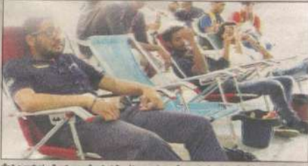
ಕೆಜೆಎಫ್ ಜೈನ್ ಕಾಲೇಜಿನಲ್ಲಿ ತನವಾರ ಆಯೋಜಿಸಲಾಗಿದ್ದ ರಕ್ತದಾನ ತಿಬಿರದಲ್ಲಿ ವಿದ್ಯಾರ್ಥಿಗಳು ರಕ್ತದಾನ ಮಾಡಿದರು.