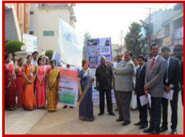
Helmet Awareness program on 23 rd January 2018