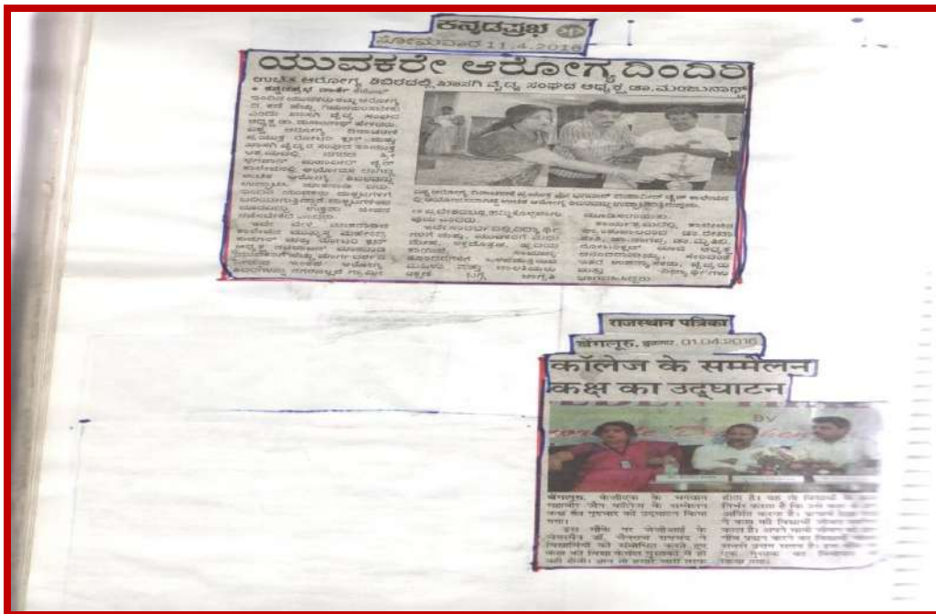
Figure 3a and 3b Special health camp organized by NSS, Rotarct Club and Indian Red cross society for public and for Sri Bhagawan Mahaveer Jain college students