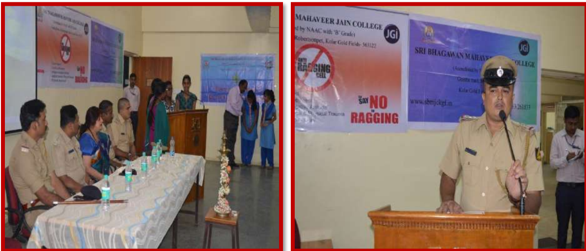
Anti Ragging Awareness Program on 2 nd Jan 2016

The Anti sexual harassment cell organized an awareness program on ragging and its impact students behavior on 2 nd Jan 2016