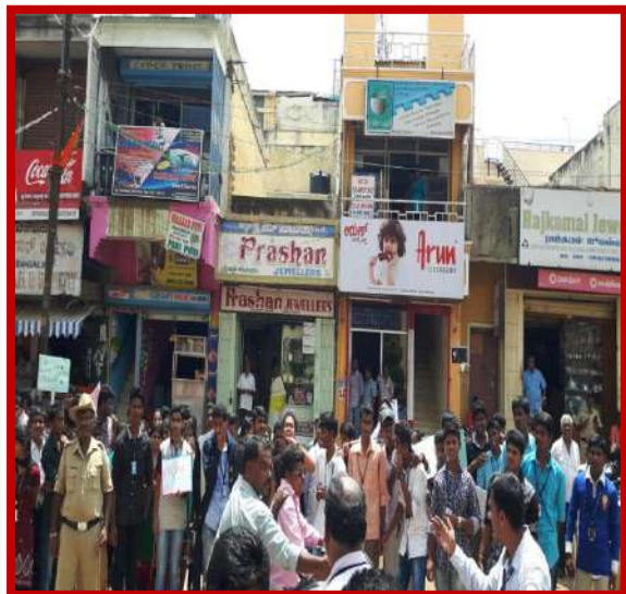
Legal awareness program on 28 th Feb 2015