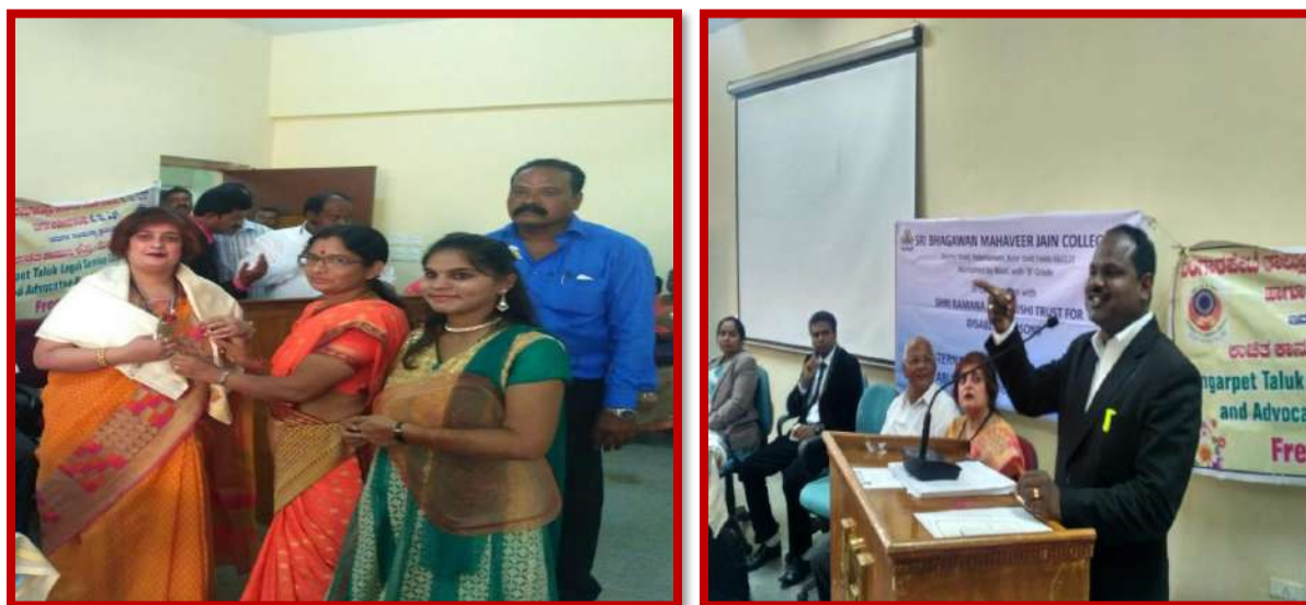
Legal Awareness program on 4 th July 2017