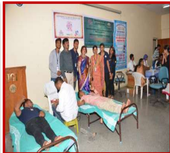
Blood Donation Camp on 7 th April 2017