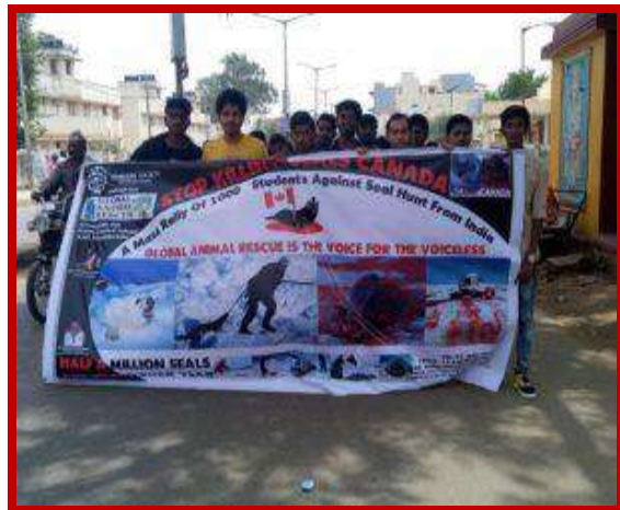
Animal Rescue Awareness program on 1 st July 2017