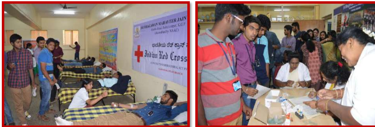
Blood donation camp on 10 th Feb 2016

Blood donation camp was organized in association with General Hospital, K.G.F and BEML,K.G.F. and Medical Centre,K.G.F. on 10 th Feb 2016. 150 students participated in this program and donated 75 Units of blood.