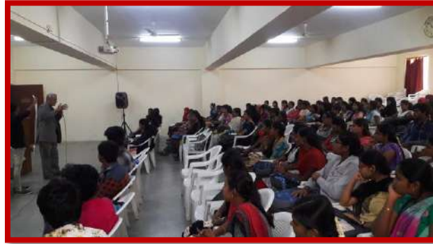
Eye donation awareness -guest lecture on 17 th July 2017