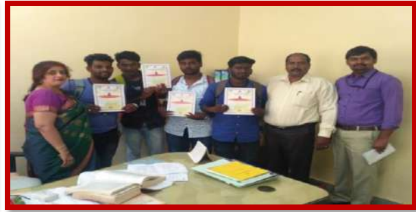
Blood donation camp on 15 th Sep 2017