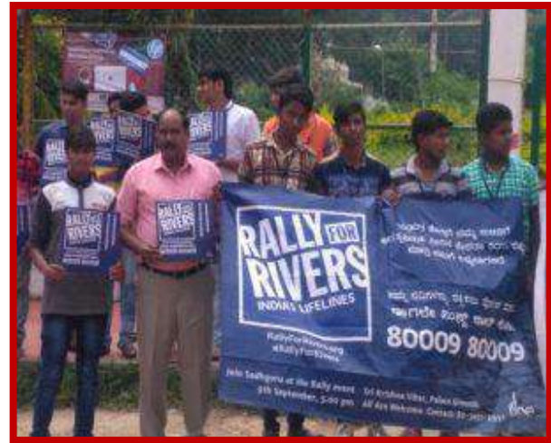
Rally for river program on 22 nd September 2017