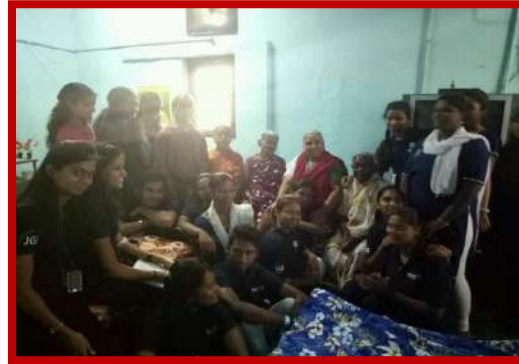
Visit to old age home on 12 th Aug 2016