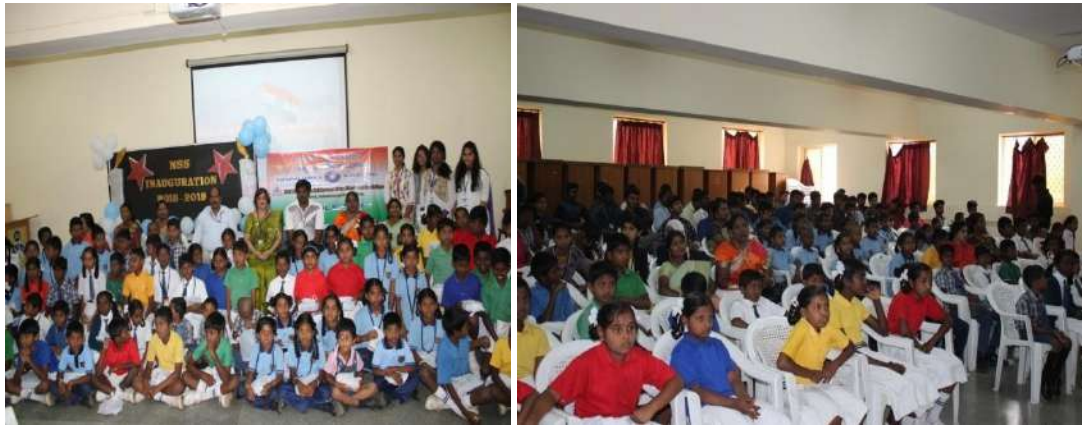
Joy of giving on 8 th Aug 2018