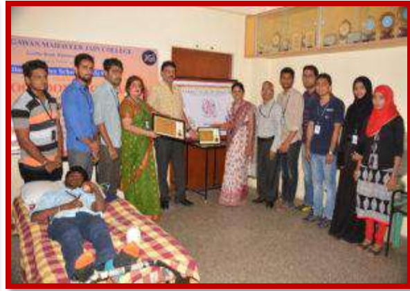
Blood Donation camp on 7 th July 2017