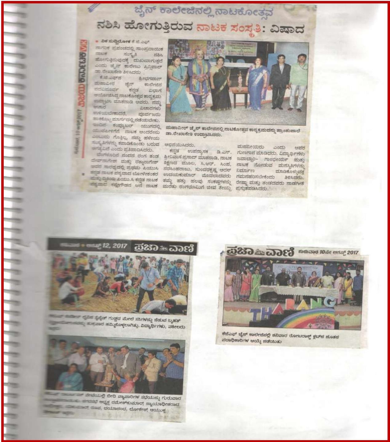
Figure 6 Plantation programe: Date: 11 th August 2017. Plantation program was organized by the Department of NSS with more than 95 students and planted more than 500 plants with the support of Forest Department of Kolar District and Law association of KGF.