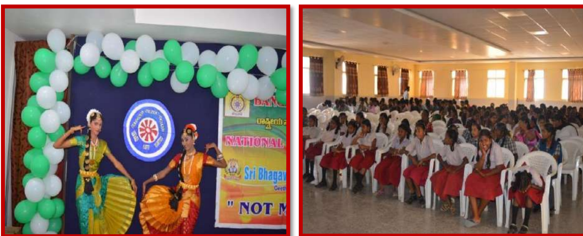
Joy of giving on 4 th July 2016

William Richards School, St Teresa primary school ,Vani School, St Teresa Tamil medium school , Vishwashariya School and Numperumal primary school