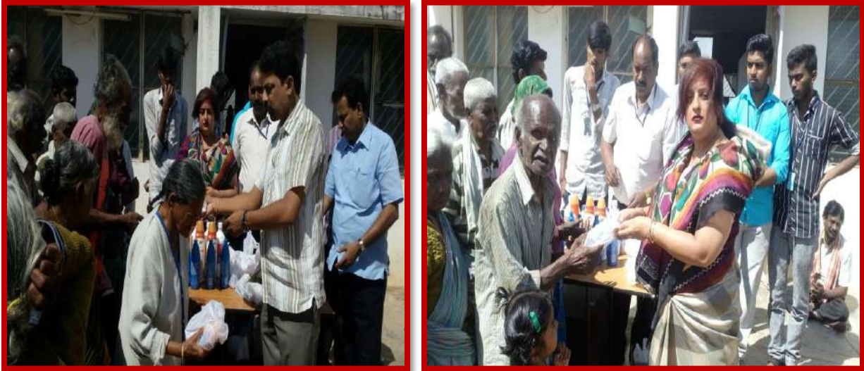
Leprosy home on 29 th Jan 2016.

NSS volunteers contributed daily requirements for leprosy patients at K.G.F. The students actively participated and interacted with them on 29 th Jan 2016.