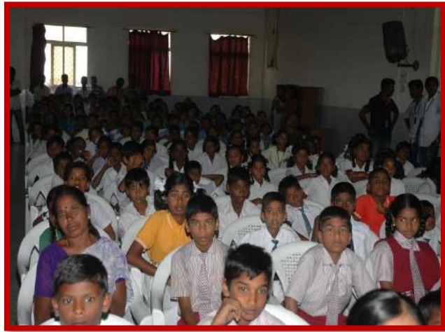
Joy of giving on 10 th Aug 2015.