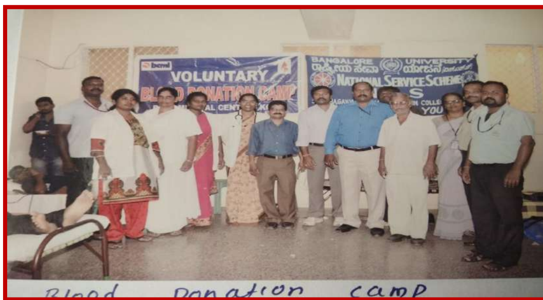
Figure Blood donation camp on 14 th Oct, 2014

Blood donation camp was organized on 14 th Oct 2014 in association with Govt General Hospital, K.G.F and BEML medical centre, K.G.F. 85 students participated in this program.