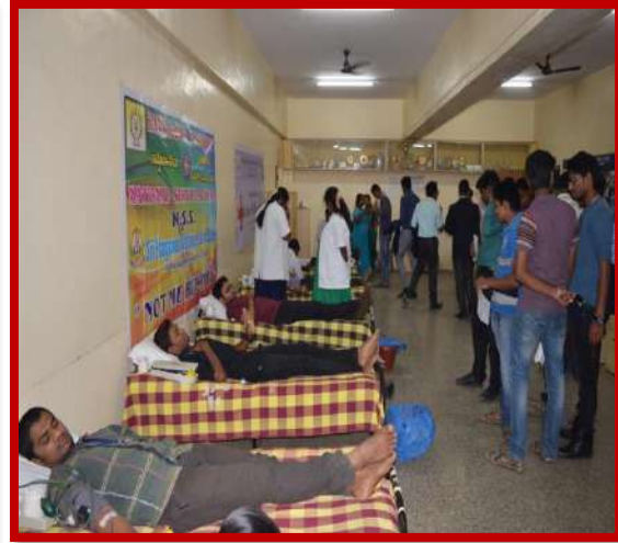
Blood donation camp on 27 th Feb, 2015