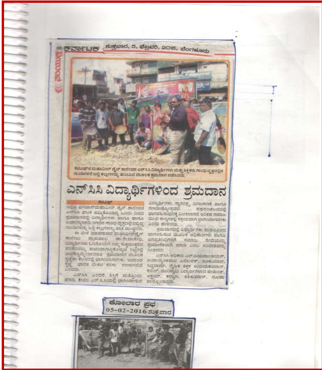
Figure 1 Shramadan at Gandhi Circle K.G.F organized by NSS Unit. 04/02/2016