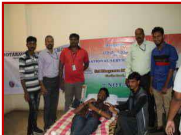
Blood Donation Camp on Founders Day organized by NNS unit on 7 th July 2018