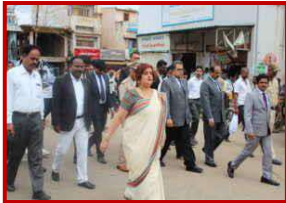
Human Trafficking Rally on 7 th July 2018