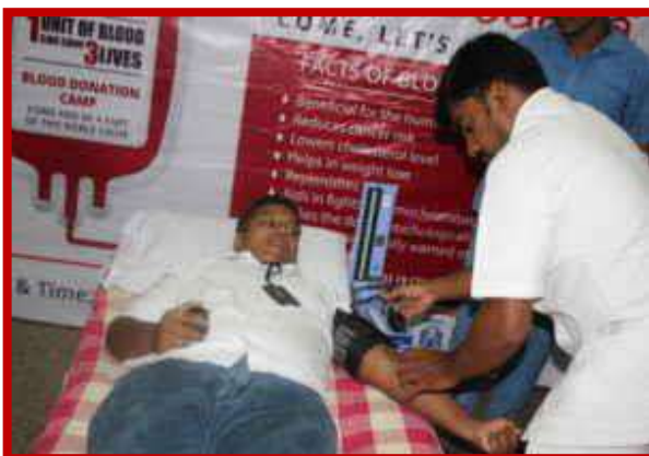
Blood Donation Camp on Founders Day organized by Indian Red Cross Society on 7 th July 2018