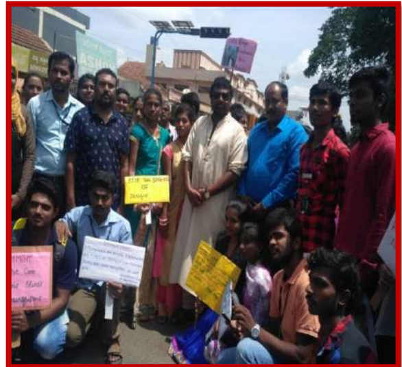
Rally on dengue and its prevention 22 nd July 2017