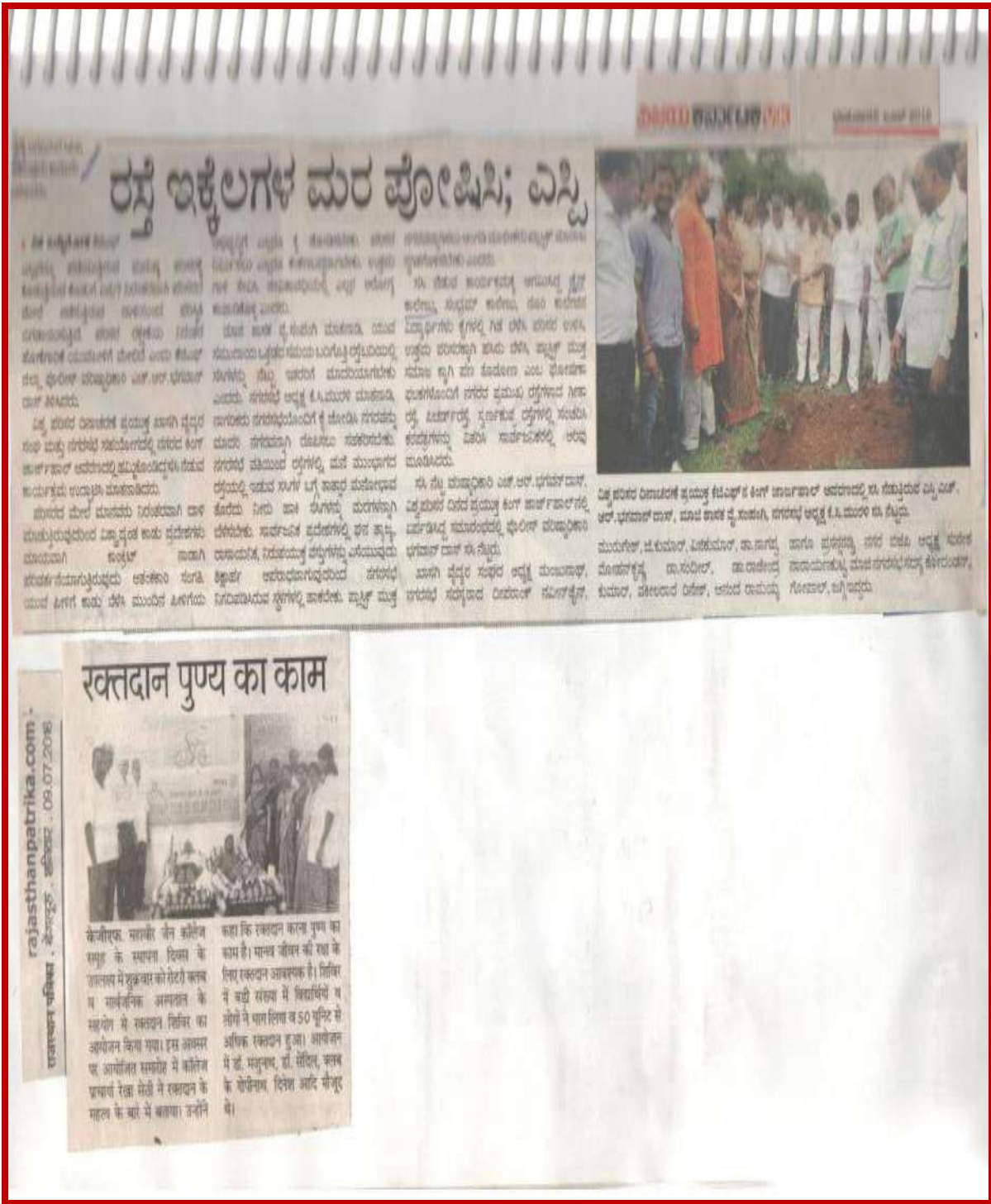
Figure 4 World environmental day observed and planted and sapling at King George hall park by Sri Bhagawan Mahaveer Jain college in association with Municipality of K.G.F, Department of police and other educational instutions of K.G.F